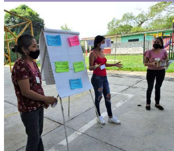
Participantes en taller de Replica sobre Marco Jurídico y Participación Política, Xilitla

Yo pienso que es importante la participación de las mujeres porque tienen conocimientos de seriedad, ahorro, organización y siempre buscan estrategias para solucionar problemas, he conocido mujeres que no pueden participar porque los maridos no las dejan salir quieren que estén en la casa atendiendo y haciendo los quehaceres, yo como mujer siento que cada una tiene algo especial que sirve como complemento para crear cosas nuevas pero que necesitamos descubrirlo.