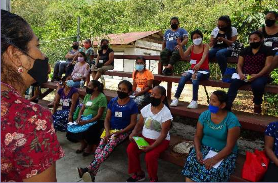
Participantes en talleres comunitarios de replica Municipio de Xilitla