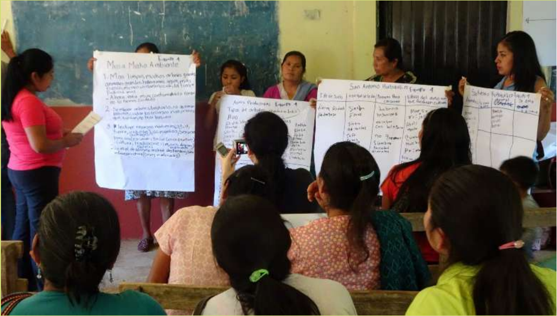
Sesión de diagnostico comunitario, Ejido San Antonio Huitzilquico, Xilitla

N anitlakuilojketl ipansetlanechikolsiuamej kampaj titlatsomaj koxtekatl katlij timoyekoliyaj ipanij toteyoual nanitekitij kampaj mochiuaj tlanechikolij uaj kampaj timokauaj kenijkij mochiuas, nanimoaxitij kampaj tlamachtlistlij ipanoteyoual uapantlatilankaj, katlej tekittl moitouaj nikakiliyaj kualij tlen nij tisiuamej pampaj nitlakakiliyaj nikualij kampaj timokauaj uaj kampaj mochiuas katlij eltok chikotik tlaxitlaualij ipanochij maseualmej, nipiya 61 expoualij uanse xiuitl nechmelajtok ipasekakiuilij kampaj miyak siuamej chokaj kemaj uechiuaj katlij tlaixpanolij kimpanoj, ipanij kakakiuilij kampaj uelij timakauasej nochi katlij tiualikaj ua amouelij timajkauaj keuelij pampaj timokamatsakuaj uaj panoj tonalij touantij nitisiuamej ayekmoj uelis timotent-sakuasej katlij techpanoj kiampaj techtlakakilisej.