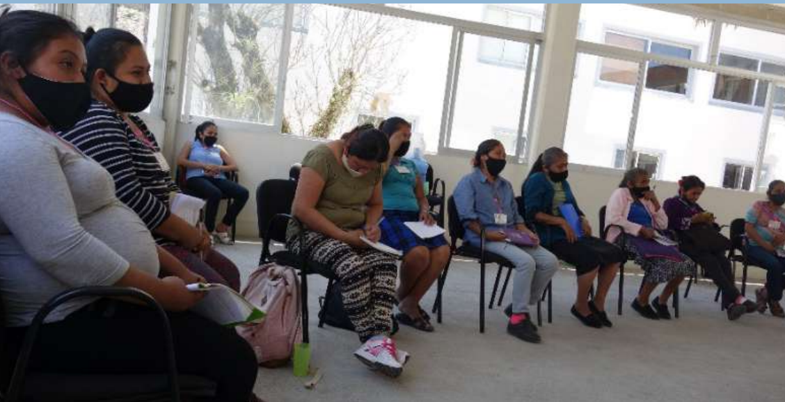
Participantes en Modulo de la Escuela de formación de Defensoras, Xilitla, S.L.P.