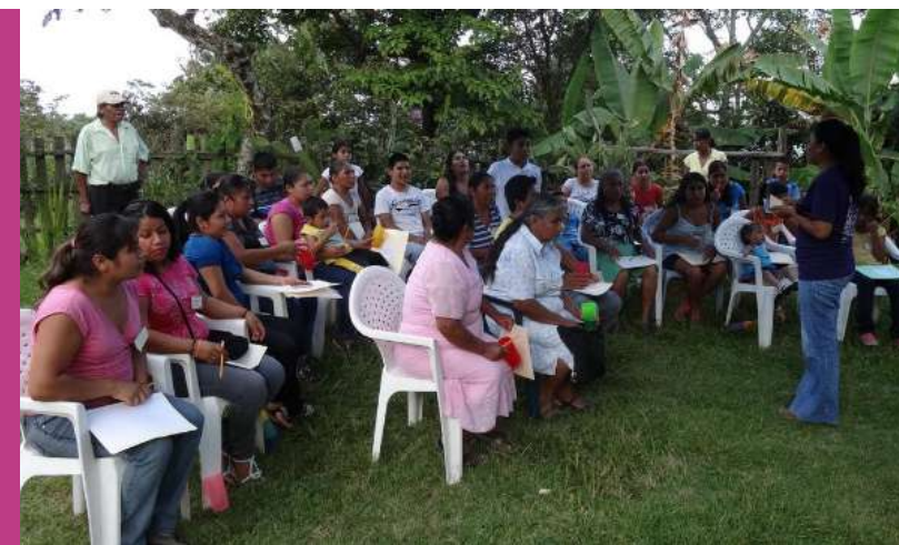
Taller comunitario de Derechos Agrarios de las Mujeres, Apetzco, Xilitla, S.L.P.