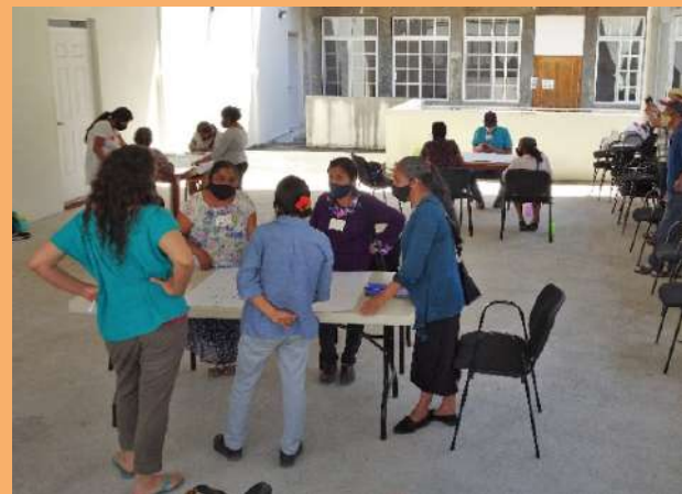
Taller de Formación de Defensoras, Xilitla, S.L.P.