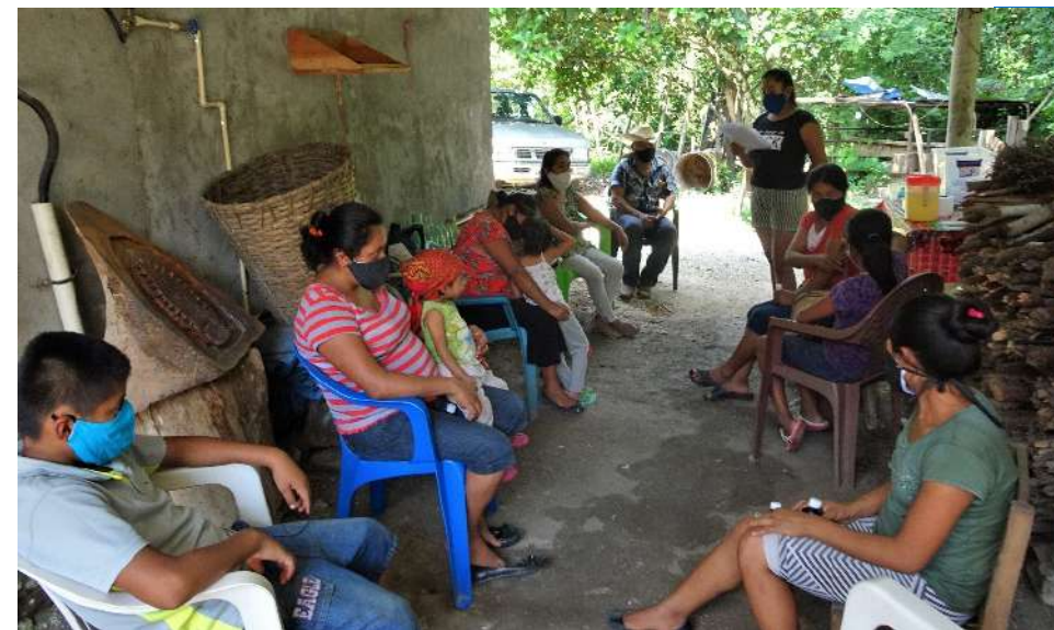
Vecinas y Margarita, sesión de Seguimiento a la Agenda de Género, La Ceiba-Tenexcaco

N aj kena niyaj pansej tlanechikolij uan tlapaleuij uan mo neshtiliaj katlij tlamanauiyanij katly panok xiuitl ayaj ni tla paleuij tij chichikej se anse tla nenemilijkatlij ti mo tlatlanise pan nij teyamochtlj kampa tij mo paleuij ka toantij tij siuamej uan nokiaj tij chichikej katsaj ti mo chiuase pualijnaj naj kin paluiaj ni suatl kenaj nex paktiaj ni tlapauis katlij tesh poluaj nij tij suamej uan amo nij pinauaj kena nij uechiua pan sej uellij tekitiketl pan ullij altepetl kena tij kitakej tlen tij nochij tij siuamej. Kena noj niaj kenaj mo nechikoaj pannij tlamachtitij katli tlamanauiyanij uan tlashitlaulistlij pan nij teyuallij uan altepeco. Kena nokiaj tech neshtilia kenkatsa tij uechiuase pansej tlanechicolij kampa tech machtiaj katli tuantij, amo tij machiliaj kenkatsa tij uechiuase pan nij to teyual ka to uanpoyuaj uan kepa uakaj ue-llij altepetl katly tekitinij tech kakisej uan tech paleuisej, kenaj ni matchilitij kemampaya amo aki tech elnamikij sankej ti koshtoya, san kalitij tij iztoke ni tij suamej ama tipeualtikey ti mo machtiaj tla shitlaulistlij uan tlamanaui kanij tij siuamej masehualme na no tocash.